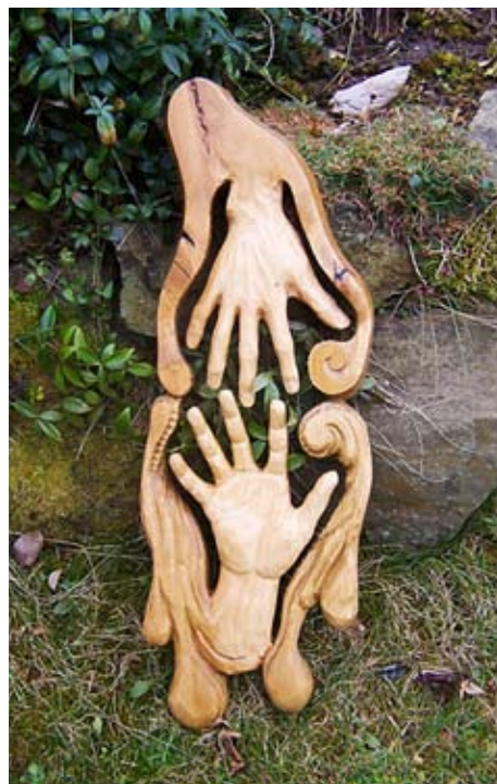
Autor dřevorezby: Petr Steffan