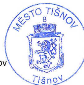
Bc. Jiří Dospíšil starosta města Tišnov

Vyvěšeno na úřední desce: 2. 10. 2017 Sejmuto z úřední desky: