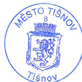
Bc. Jiří Dospíšil starosta města Tišnov

Vyvěšeno na úřední desce: 2. 10. 2017 Sejmuto z úřední desky: