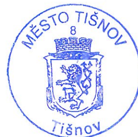
Bc. Jiří Dospíšil starosta města Tišnov

Vyvěšeno na úřední desce: 5. 6. 2018 Sejmuto z úřední desky: