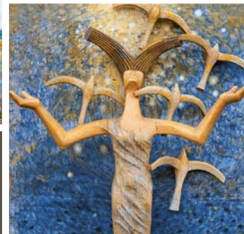
Petr Groh DŘEVOŘEZBY