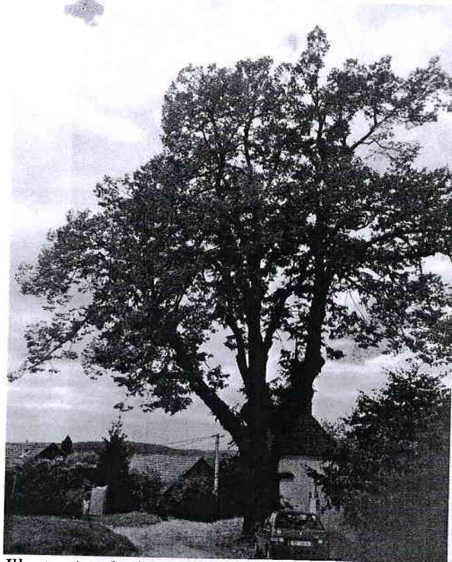
Illustration 1: Celkový pohled na strom