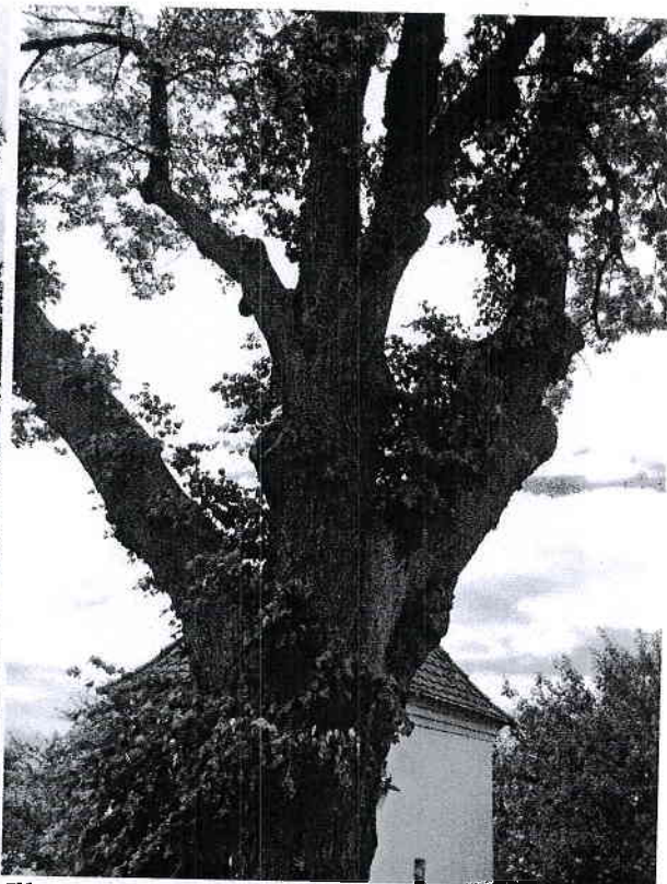
Illustration 2: Detail kosterního větvení