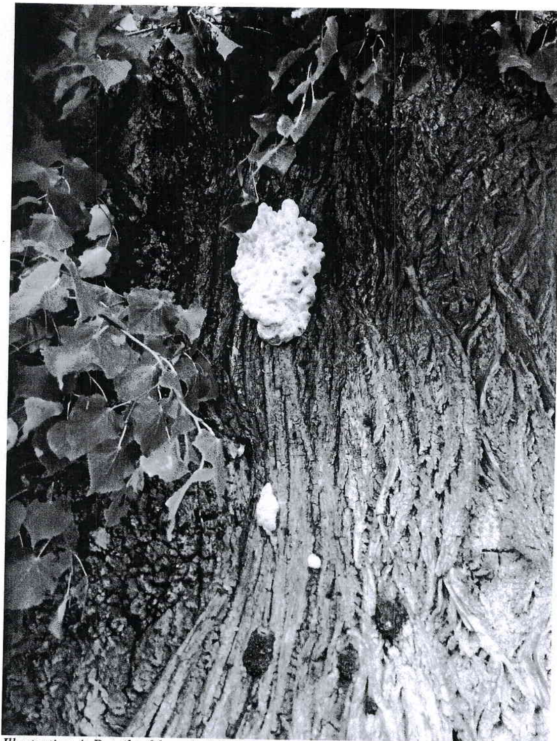
Illustration 4: Detail infekce plodnic sírovce žlutooranžového na kmeni stromu.