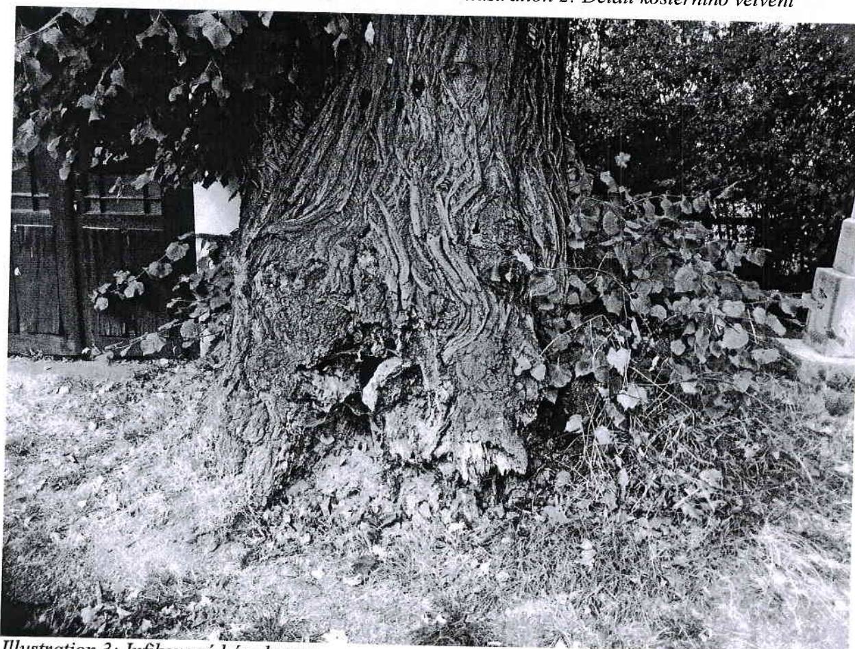
Illustration 3: Infikovaná báze kmene