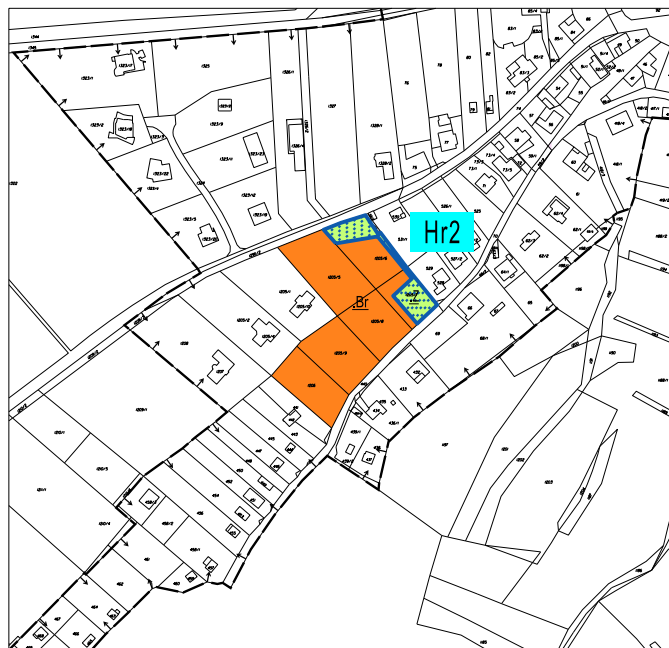
Polohopisným podkladem je katastrální mapa, poskytnutá ČÚZK /07-2020/. Využití těchto dat se řídí podmínkami dle internetových stránek ČÚZK.

Pro přehlednost navrhované změny je prezentován výřez z platného územního plánu Hradčany